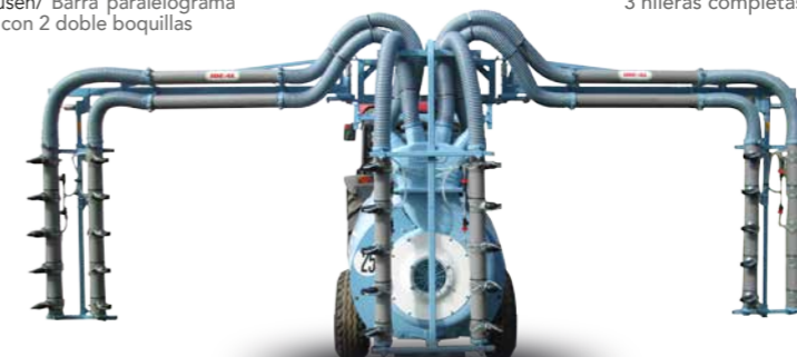
■ Barra idraulica 3 file completa - 6 diffusori con 5 flop/ Hydraulic boom 3 complete rows - 6 diffusers with 5 flops / Rampe hydraulique 3 rangée - 6 distributeurs avec 5 flops / Hydraulik- Balken, 3 komplette Reihen -6 verteiler mit 5 flop / Barra hidráulica para 3 hileras completas - 6 difusores con 5 flop