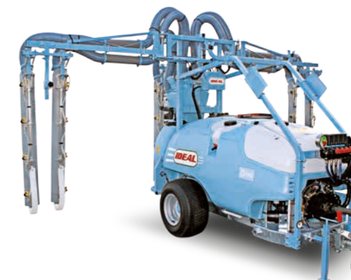
■ Barra idraulica 3 file completa - 6 Turbo Star / Folding hydraulic boom 3 complete rows - 6 Turbo Star / Rampe repliage hydraulique 3 rangée - 6 Turbo Star / Hydraulik-Balken, 3 komplette Reihen 6 Turbostar / Barra hidráulica para 3 hileras completas - 6 Turbo Star