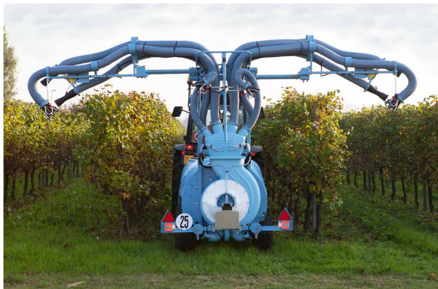
■ Barra idraulica estensibile ripiegabile con movimento elettrico dei cannoncini - 3 file / Boom with hydraulic extension - hydraulic folding - electric adjustment of canons little guns - 3 rows / Rampe Rexo 145 repliage et extension hydraulique - Orientation électrique des canons - 3 rangée / Hydraulisch ausdehnbarer, klappbarer Balken mit elektrischer Verstellung der kleinen Sprühkanonen - 3 Reihen/ Barra con extensión y repliegue hidráulicos y movimiento eléctrico de los difusores - 3 hileras