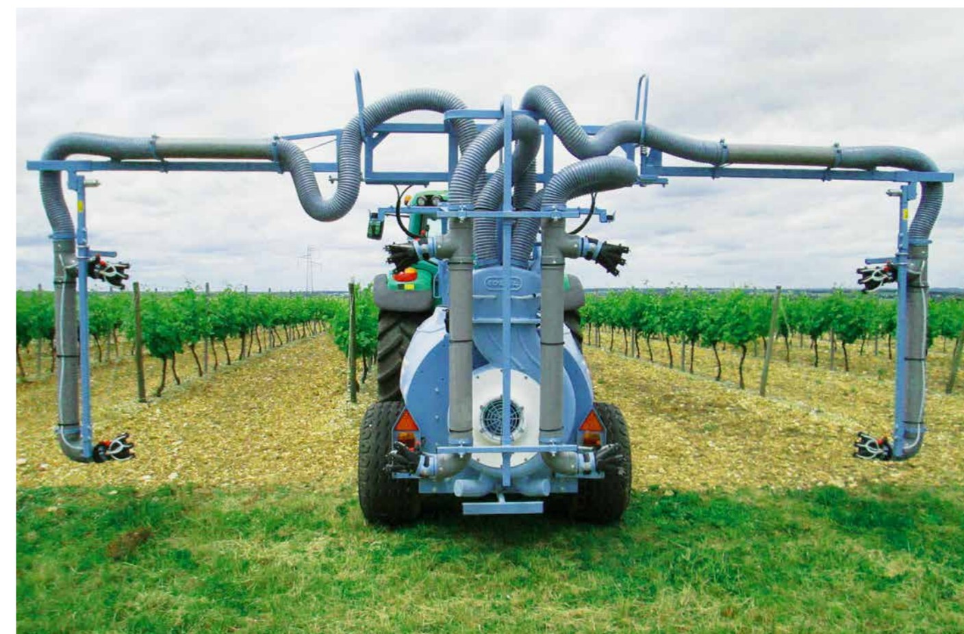
■ Barra idraulica ripiegabile - 2 file / Boom with hydraulic folding - 2 rows/ Rampe repliage hydraulique - 2 rangée / Hydraulisch klappbarer Balken - 2 Reihen / Barra hidráulica - 2 hileras