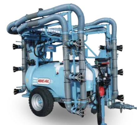
■ Barra parallelogramma 3 file - 7 martinetti 18 diffusori con doppio getto ottono / Parallelogram for 3 rows - 7 jacks 18 diffusers with double jets / Rampe parallelogramme 3 rangées - 7 vérins 18 distributeurs avec jets double / Parallelogrammbalken 3 Reihen - 7 Funktionen 18 Verteiler mit Doppel Düsen/ Barra paralelograma para 3 hileras - 7 pistones 18 difusores con 2 doble boquillas